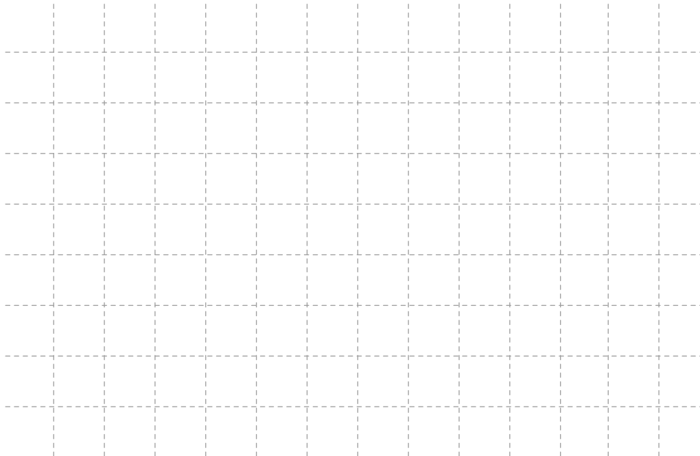
Stendo grindų planas. 1 langelis – 1 m 2

Prašome, žemiau pateiktame plote nubraižyti papildomos įrangos ir baldų išdėstymo tvarką jūsų stende